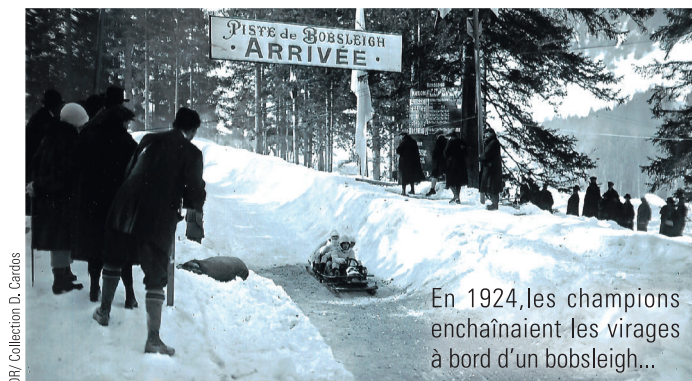
DR/ Collection D. Cardos

Lieux des spectacles à suivre sur la page Hervé Laplante | Facebook